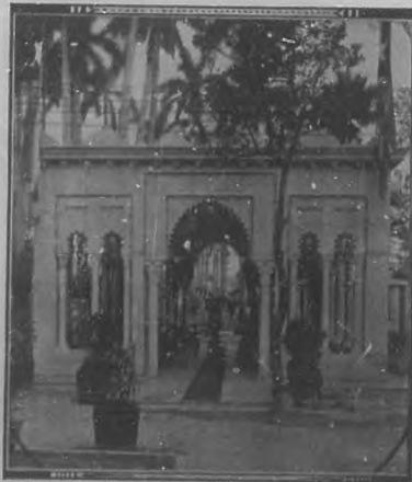
Pabellón de las Villas.—Construído con materiales de la Fábrica de A. Gelabert.