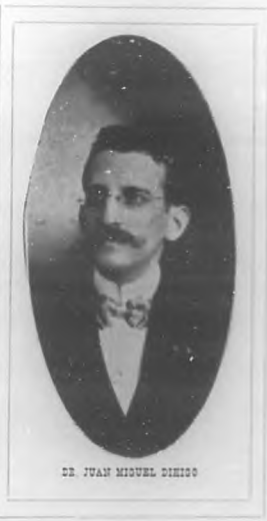
DR. JUAN MIGUEL DIHIGO

dad, para abrir á las empobrecidas actividades del pueblo cubano nuevos derroteros, transformaron, con esfuerzo perseverante, la vieja escuela, albergue el más acomodado de la rutina, en el laico seminario que á todos abre sus puertas, porque su enseñanza es gratuita y obligatoria, de donde ha de salir, tonificada su voluntad por la educación del carácter y desarrollada su inteligencia por la investigación de la verdad, una generación nueva, apta para desenvolverse en todos los empeños, lo mismo en los que tocan á las más altas cimas del ideal, que en aquellos otros, relacionados con la conquista del bienestar económico, en torno del cual gira al presente la actividad humana.