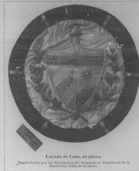
Escudo de Cuba, de plata.

Tablero con hebillas de diferentes modelos.