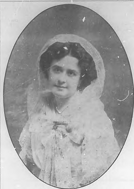
S. M. EMLINA I, REINA EN EL CERTAMEN DE BELLEZA DE CRUCES

Día hubo en que nos sentimos víctimas de desaliento lle-