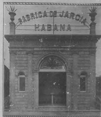
EXHIBICIÓN DE LA FÁBRICA DE JARCIA.—LA FACHADA