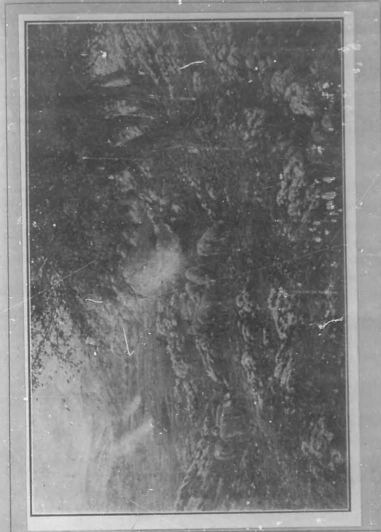
EL OTORO EN LA MONTANA