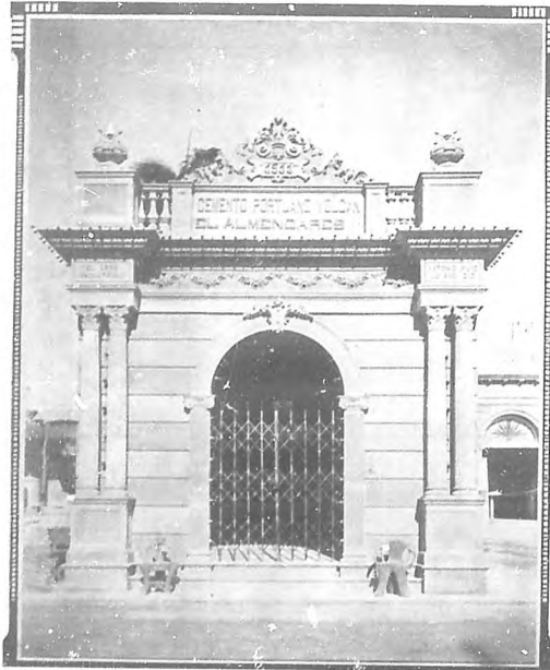
VISTA EXTERIOR DEL PABELLON DE LA GRAN FABRICA DE CEMENTO "EL ALMENDARES".