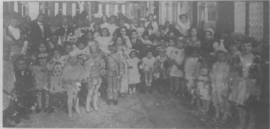
OTRO ASPECTO DEL BAILE INFANTIL CELEBRADO EL PASADO DOMINGO EN EL PALACIO DE LA ASOCIACION DE DEPENDIENTES DEL COMERCIO DE LA BARANA.