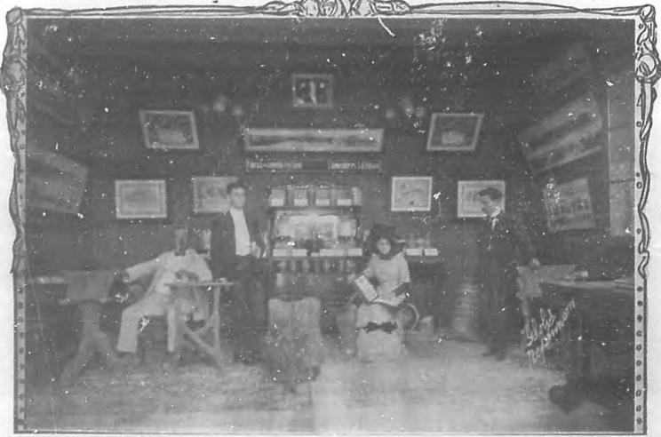
INTERIOR DEL PABELLON DE LA GRAN FABRICA DE CEMENTO "EL ALMENDARES" EN QUE SE EXHIBEN ALGUNAS MUESTRAS DE SUS ADMIRABLES TRABAJOS.