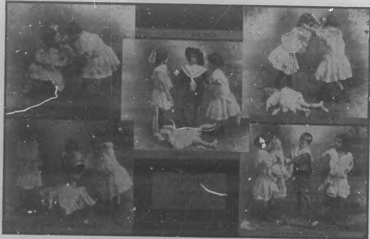
Fotografías artísticas presentadas por el popular fotógrafo Ramón Carreras.

señor Carreras, á quien sinceramente felicitamos por su éxito en la Exposición.