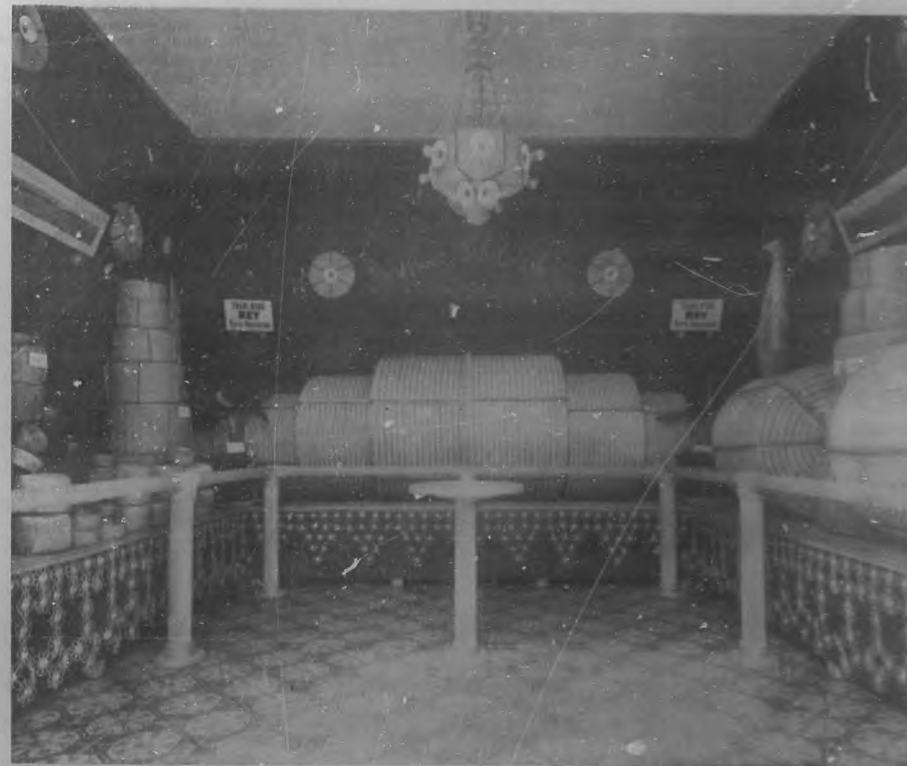
VISTA INTERIOR DE LA EXHIBICIÓN DE LA "FÁBRICA DE JARCIA" PREMIADA CON EL "GRAN PREMIO".