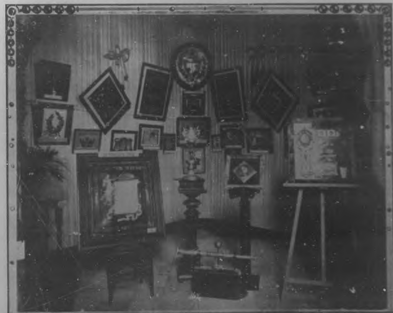
Elegante instalación del gran taller de joyería "La Estrella de Italia".

Puede servir dicha visita para apreciar la importancia de la industria que el arte impulsa en aquellos talleres en los que dibujantes, grabadores, cinceladores, bruñidores, todos los que allí laboran, en fin, parecen estar bajo la influencia de la enseñanza del país de la poesía y del arte.